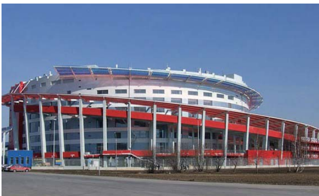
モスクワ<メガ・スポーツ>

【1日目】(午後)成田⇒(夕刻)モスクワ<<モスクワ泊/朝×昼×夕×>> 【2日目】(午前)ショッピング<ボスコ・スポーツ>(午後)アイスホッケー観戦~ロシアvsチェコ~<<モスクワ泊/朝○昼○夕×>> 【3日目】(午前)自由行動(午後)アイスホッケー観戦~ロシアvsフィンランド~<<モスクワ泊/朝○昼×夕×>> 【4日目】(午前)モスクワ観光(夜)モスクワ~<<機中泊/朝○昼○夕×>> 【5日目】(午前)→成田